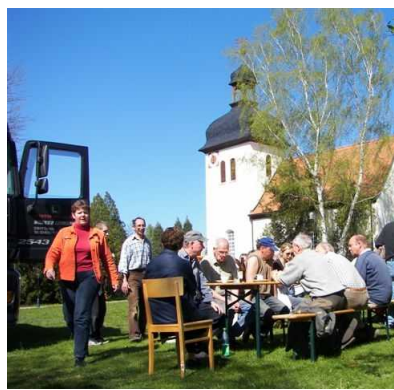
nach dem Friedhofeseinsatz in Törten

Wir treffen uns am 13.10.2007 an der Kreuzkirche um 09:00 Uhr sowie auf dem Friedhof in Törten am 20.10.2007 um 08:30 Uhr.