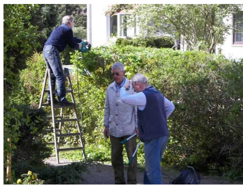
beim Frühjahrsputz an der Kreuzkirche