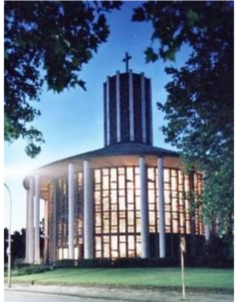
Friedenskirche Ludwigshafen bei Nacht