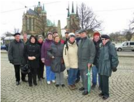
Der Gemeindegemeinderat mit Partnern in Erfurt

Im März 2010 war der Gemeindegemeinderat zu einer Wochenendtagung in Neudietendorf bei Erfurt.