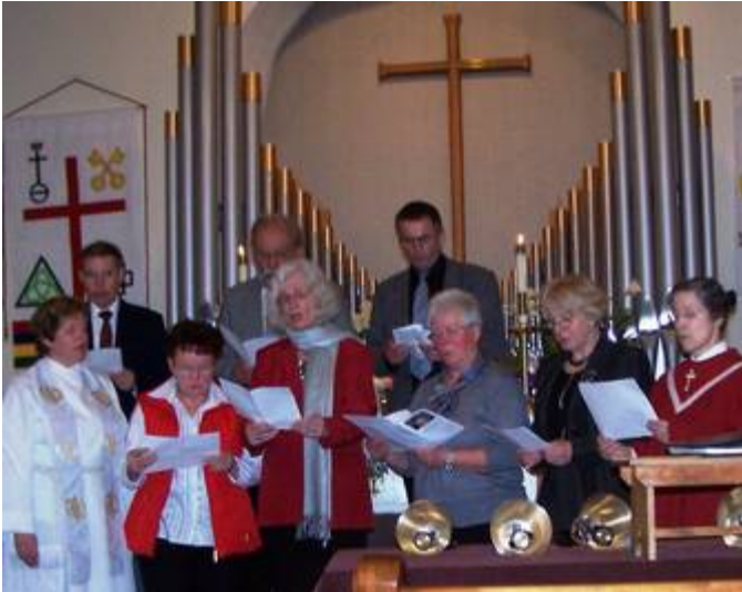
Unserer Gruppe singt im Gottesdienst ein deutsches Osterlied