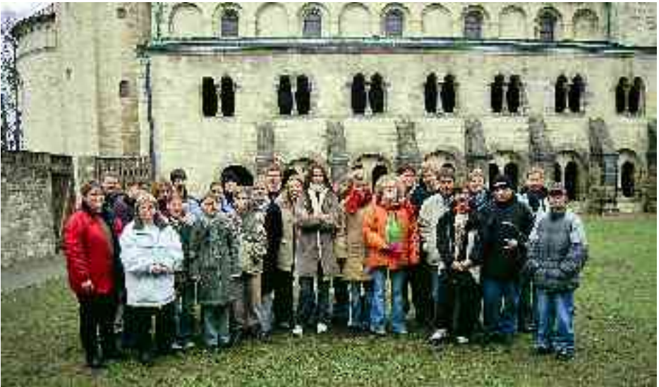
Die „bunte Truppe“ im Kreuzgang der Stiftskirche