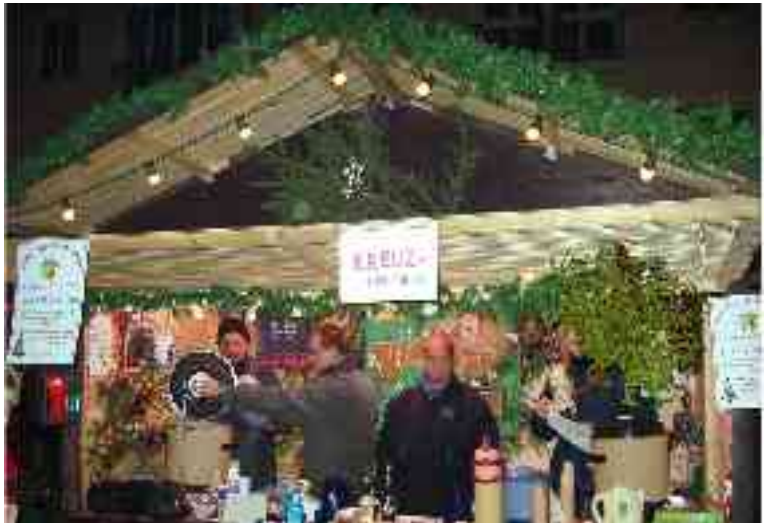
Glühweinstand der Kreuzgemeinde auf dem Dessauer Weihnachtsmarkt